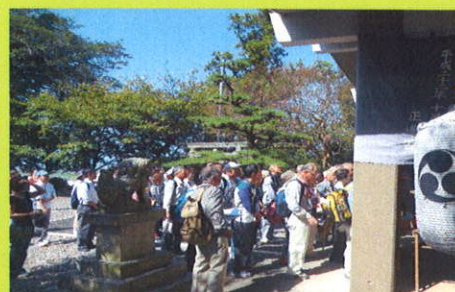
※写真は H25年10月 秋のウォークラリーの様子