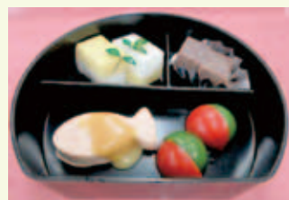
嚥下調整食のおせち