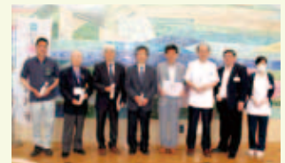
岩出口タリークラブ様