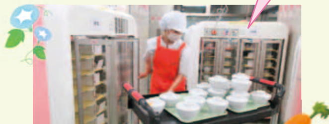
配膳前の栄養士チェック

委託業者は、「 味と真心で社会に奉仕する 」を経営理念に掲げ、日々患者さまに美味しく、安全な食事を召し上がっていただけるように心掛けております。清潔な環境を維持し、真心をこめて料理を作っていますので、ご愛顧の程よろしくお願ひ致します。