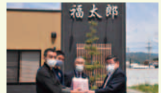
季節料理 福太郎 他 地元事業主の有志ご一同様