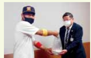
喰 shockBAR Replay 様