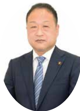
公立那賀病院経営事務組合 管理者 紀の川市長

結びに、地域住民の皆さまのご健勝とご多幸を祈念申し上げ、年頭のご挨拶とさせていただきます。