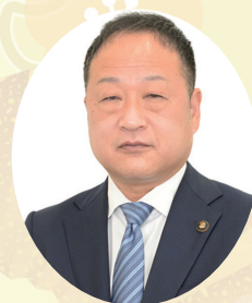
公立那賀病院経営事務組合管理者 紀の川市長

結びに、地域住民の皆さまのご健勝とご多幸をお祈り申し上げ、新年のご挨拶とさせていただきます。